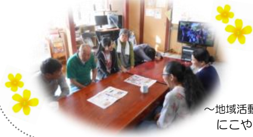
～地域活動センターくろゆりにて～ にこやかに話中♪