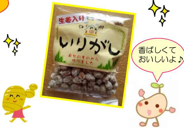
※いりがしは就労支援センターつばさで手作りしています

この秋、自主製品のいりがしに生姜入り大豆が仲間入り！生姜には血行促進の効果があるのでこれからの季節にオススメです。 他にもお米、かきもちなどのいりがしに加え軽い口当たりで人気のぼんせんべいもあります。これらの商品はなごみの郷館内の売店の他、道の駅こまつ木場湯、JAあぐり、Aコープの今江店・栗津店や、市内外で行われるイベントの販売会で買い求められます。ぜひご賞味下さい。