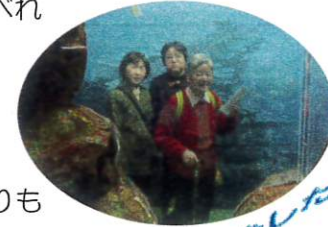
旅行に行きました!

富山県の水族館に行って来ました。色々な魚がなかよく泳いでいたのでびっくりしました。ほたるイカがきれいな青い光を放って小さい光が消えたり光ったりして、それがお昼に昼食に変身しておいしくたべれました。ここで写真を撮りました。職員のとや同じ精神の患者どうしが親子よりも仲良しのような気がしました。ありがとうございました。